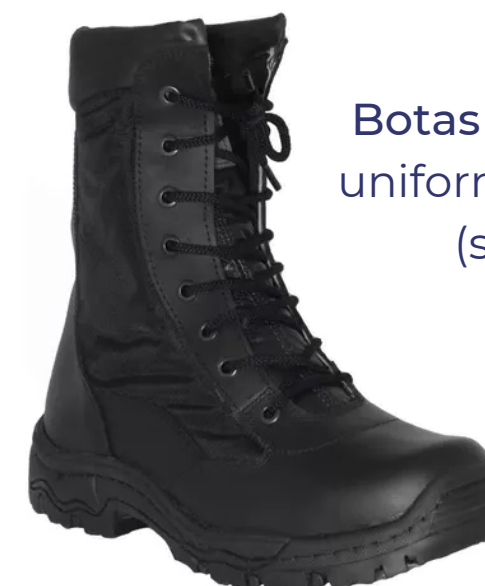
Botas y botines : para uniforme blanco y kaki (secundaria)