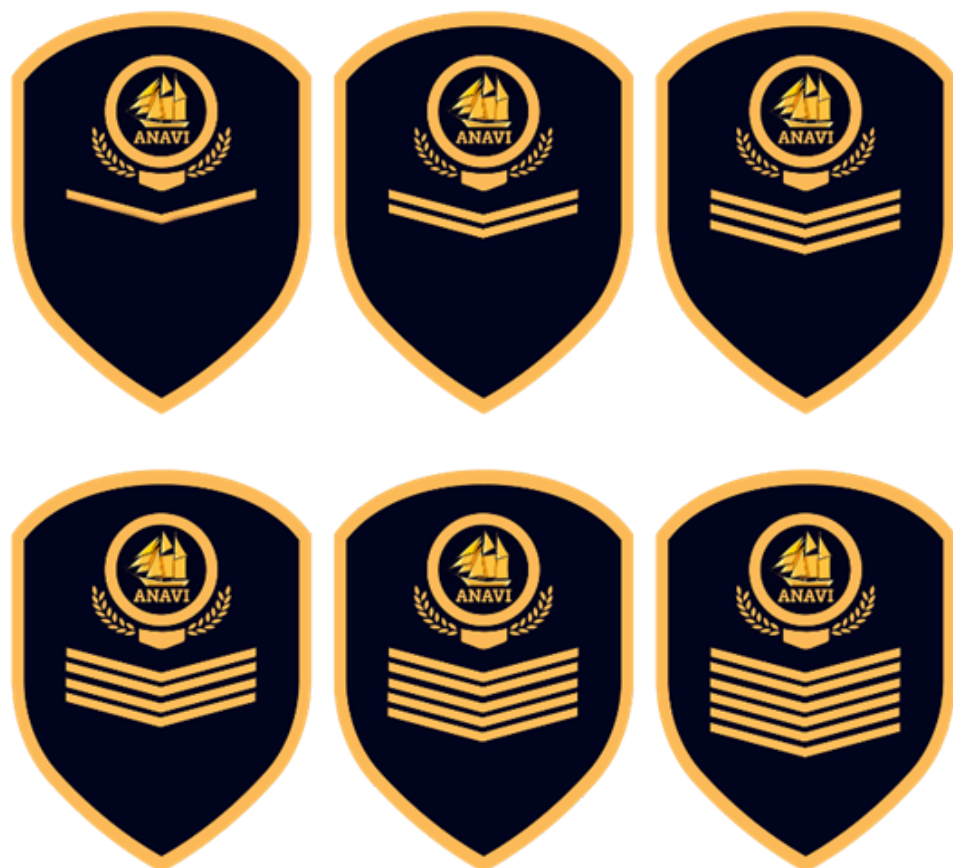
Parche segun el nivel de educación (secundaria)