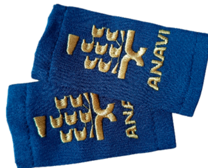
Palas para uniforme blanco y kaki