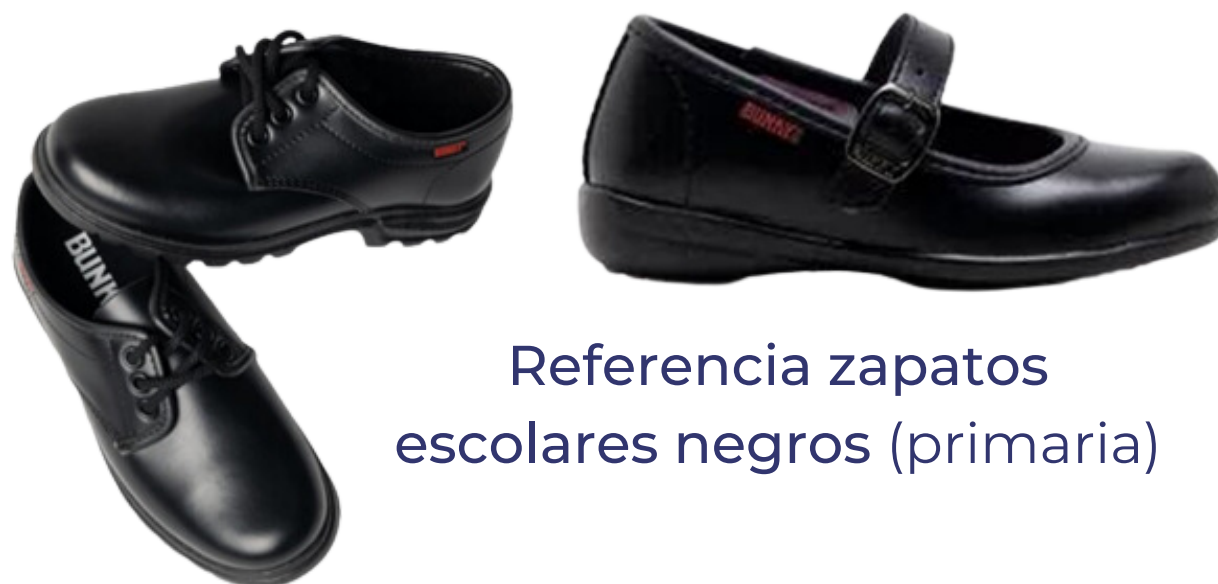
Referencia zapatos escolares negros (primaria)