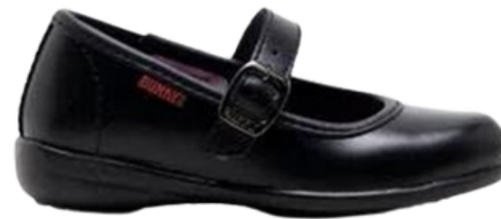
Referencia zapatos escolares negros (primaria)