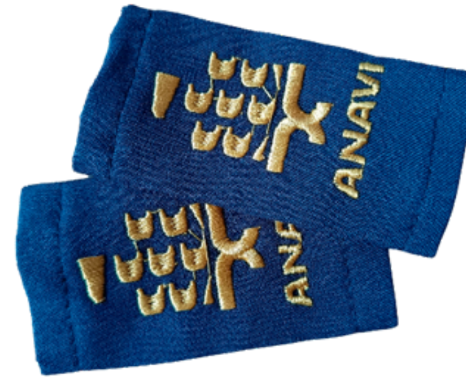
Palas para uniforme blanco y kaki