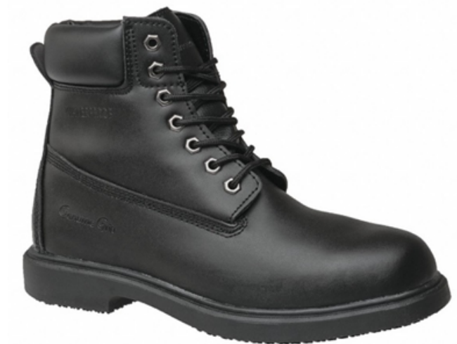
Botines caña baja para mujeres